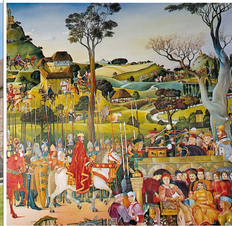
🏰 Das 2002 erstellte Stauferrundbild im Kapitelsaal zeigt den Aufstieg und Niedergang der Staufer

setzte, errichtete der Konvent die sogenannte Staufertumba als Schaugrab des verehrten Stiftergeschlechts. 1475 ließ der damalige Abt sämtliche Staufergräber öffnen und die Überreste in die prachtvolle Tumba im Mittelschiff umbetten.