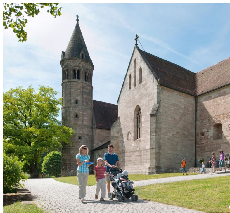
🏰 Das Klostergelände lädt zu Spaziergängen ein, dank der Barrierefreiheit auch mit Kinderwagen

Während im östlichen Teil verschiedene Wirtschaftsgebäude erhalten sind, erhebt sich im Westen stolz der Marsiliusturm. Der Aufstieg wird hier mit einem traumhaften Blick über das Klosterareal belohnt. Kirche, Klausur und Kräutergarten sowie das Wohn- und Gästehaus des Abtes und die Wirtschaftsgebäude bilden ein eindrucksvolles Ensemble und sind von einer vollständig erhaltenen Ringmauer umgeben. Einst mit zwei Kirchtürmen errichtet, ist der mächtige romanische Kirchenbau einem Kreuz als Grundriss nachempfunden. Die exponierte Lage und weithin sichtbare Silhouette bezeugen noch heute den einstigen Rang und Reichtum dieser staufischen Klosterstiftung.