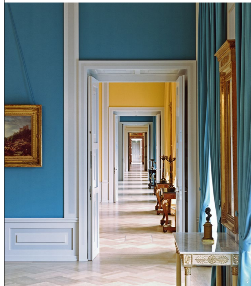
👑 Die Prunkräume liegen alle in einer Achse – über die gesamte Länge der Beletage