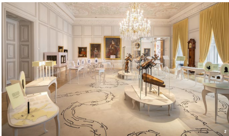
👑 Der Erlebnisraum Hofmusik im Trabantensaal

Das im Barockstil errichtete Schloss besteht aus fünf Flügeln. Die lang gestreckten Fassaden haben meist drei Stockwerke, die in den Bau eingefügten vierstöckigen Pavillons lockern die Strenge der rechtwinkligen Architektur auf.