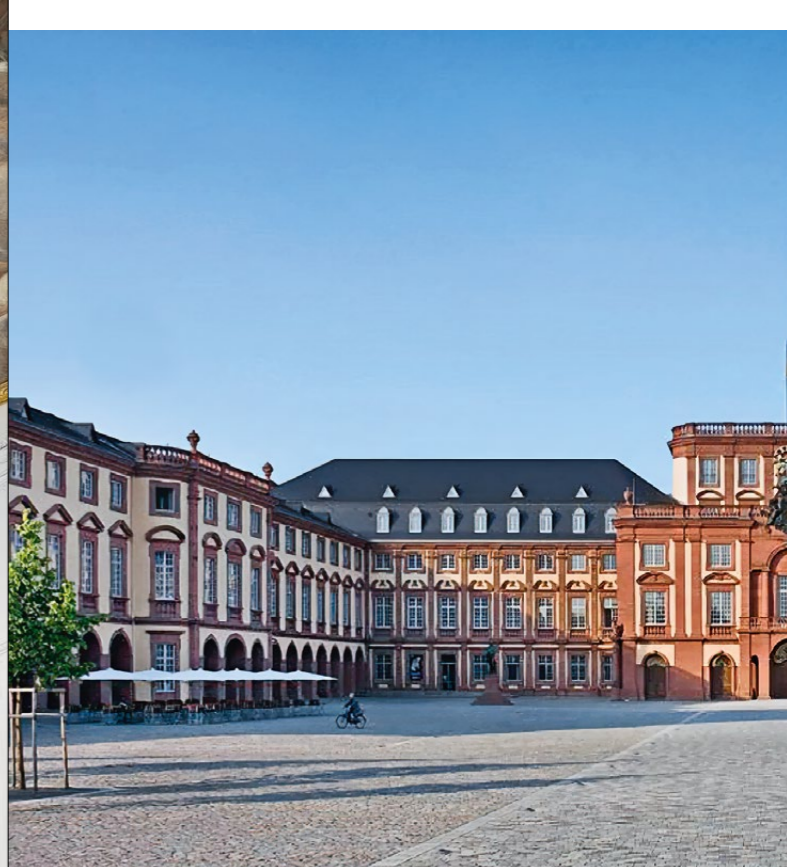
Barockschloss Mannheim mit Ehrenhof und Schaufassade

VIEL GERÜHMTER MUSENHOF UND ZWEITE BLÜTE Das Mannheimer Schloss ist das zweitgrößte geplante Barockensemble Europas , nach Schloss Versailles. Dies sollte u. a. die bedeutende Stellung repräsentieren, die die Kurfürsten von der Pfalz im Heiligen Römischen Reich Deutscher Nation einnahmen. 1720 verlegte Kurfürst Carl Philipp die Residenz der Kurfürsten von der Pfalz von Heidelberg nach Mannheim und ließ dort den Grundstein für den Neubau der Schlossanlage legen.